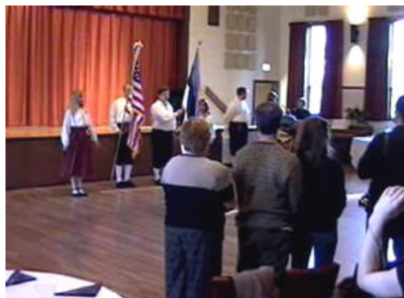
Lippude sisse toomisel laulsid saalisviibikjad Eesti hümmi

22.vebruaril tähistasime Seattle'is EV 86. aastapäeva.