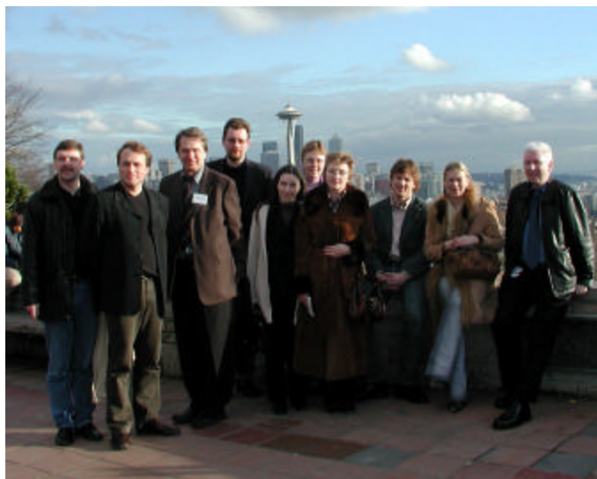
Estonian delegation members in Seattle