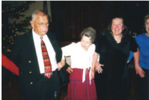
Kas puusad on? Ei tea...Katsume!

Ringmängud tõid palju lusti ja elevust ning panid osavõt- jate paled õhe- tama. Kaljo Konsa sõnul oli 2003-nda a. Jõulupidu Seattle'is üle pika aja väga