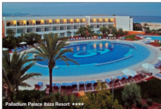
Palladium Palace Ibiza Resort *****

Valencia y Oviedo, y en breve también estará presente en las principales capitales de Europa y América.